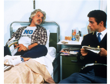
1994 POLICIER (Poliziotti) de Giulio Base avec Claudio Amendola