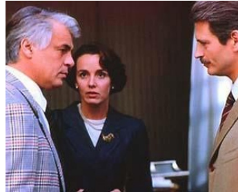
1995 UN HÉROS ORDINAIRE (Un eroe borghese) de Michele Placido avec Fabrizio Bentivoglio