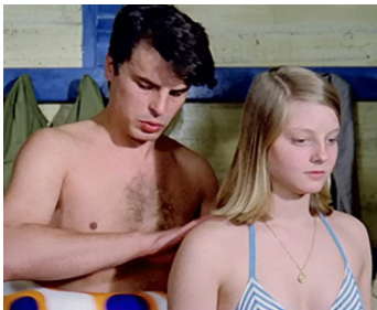
1977 LA CABINE DES AMOUREUX (Casotto) de Sergio Citti avec Jodie Foster