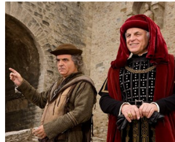
2011 AMICI MIEI (Amici miei, come tutto ebbe inizio) de Neri Parenti avec Giorgio Panariello