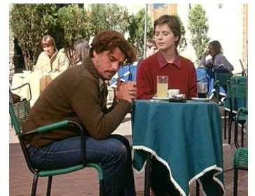
1979 LE PRÉ (Il Prato) de Paolo & Vittorio Taviani avec Isabella Rossellini