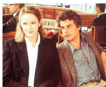
1981 LES AILES DE COLOMBE de Benoît Jacquot avec Dominique Sanda