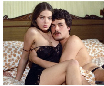
1974 ROMANCES ET CONFIDENCES (Romanzo popolare) de Mario Monicelli avec Ornella Muti