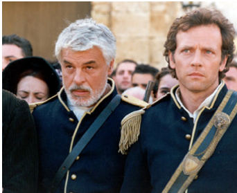
2001 ENTRE DEUX MONDES (Tra due mondi) de Fabio Conversi avec Stéphane Freiss