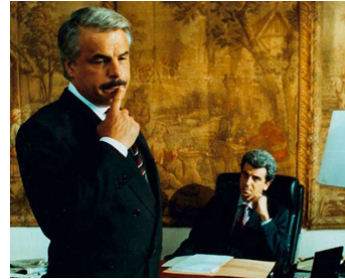
1993 GIOVANNI FALCONE de Giuseppe Ferrara avec Nello Rivière