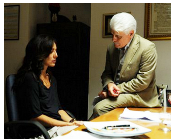
2015 LA SCELTA (La Scelta) de Michele Placido avec Ambra Angiolini