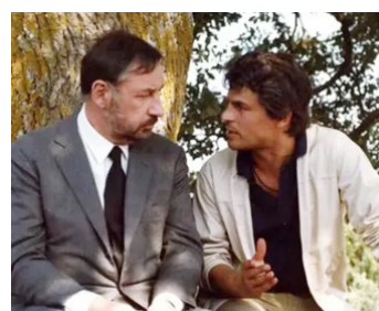
1981 TROIS FRÈRES (Tre Fratelli) de Francesco Rosi avec Philippe Noiret