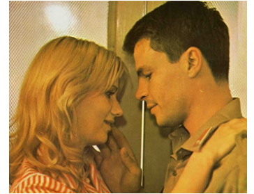
1976 LA MARCHÉ TRIOMPHALE (Marcia trionfale) de M. Bellochio avec Miou-Miou