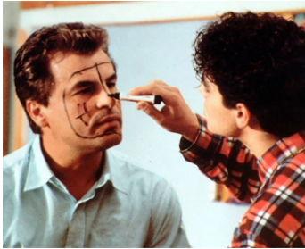
1989 MERY POUR TOUJOURS (Mery per sempre) de Marco Risi avec Claudio Amendola