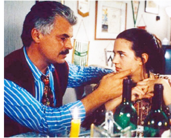
1992 LES AMIES DE CŒUR (Le Amiche del cuore) de M. Placido avec Asia Argento