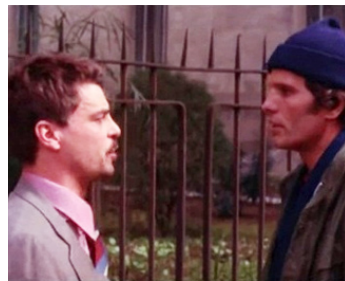
1979 UN HOMME À GENOUX (Un uomo in ginocchio) de Damiano Damiani avec Giuliano Gemma