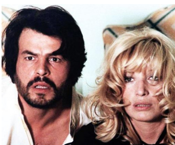
1979 LES MONSTRESSES (Letti selvaggi) de Luigi Zampa avec Monica Vitti