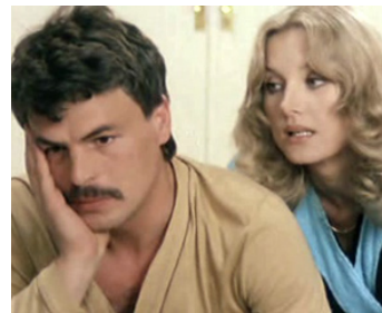
1979 SABATO, DOMENICA E VENERDI, Dimanche de P. Festa Campanile avec B. Bouchet