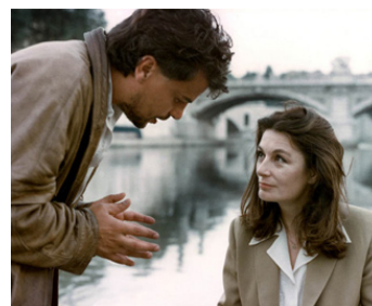
1980 LE SAUT DANS LE VIDE (Salto nel vuoto) de Marco Bellochio avec Anouk Aimée