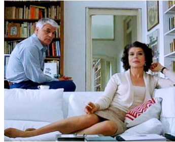
2004 L'ODEUR DU SANG (L'Odore del Sangue) de Mario Martone avec Fanny Ardant