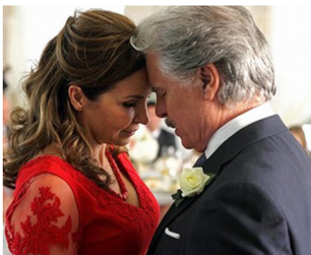
2015 IO CHE AMO SOLO TE de Marco Ponti avec Maria Pia Calzone