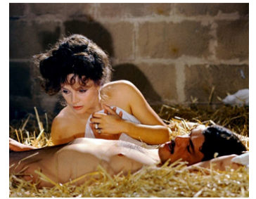
1974 MON DIEU, COMMENT SUIS-JE TOMBÉE SI BAS ? de Luigi Comencini avec L. Antonelli