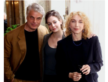
1999 UN HOMME PARFAIT (Un uomo perbene) de M. Zaccaro avec G. Mezzogiorno, M. Melato