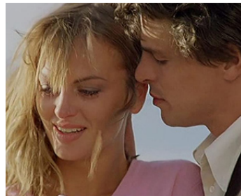
1977 L'AFFAIRE DE LA FILLE AU PYJAMA JAUNE de F. Mogherini avec Dalila Di Lazzaro