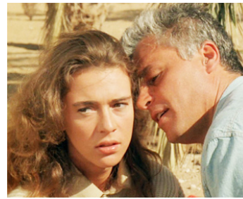
1988 Y A BON LES BLANCS (Come sono buoni i bianchi) de M. Ferreri avec Maruschka Detmers