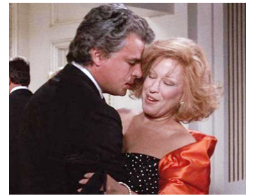
1988 QUAND LES JUMELLES S'EMMÊLENT (Big Business) de Jim Abrahams avec B. Midler