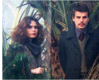
1976 LA CONSPIRATION DE LA PEUR (E tanta paura) de Paolo Cavara avec Corinne Cléry