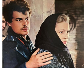
1976 L'AGNEAU VA MOURIR (L'Agnese va a morire) de G. Montaldo avec Ingrid Thulin