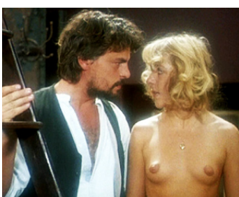
1980 LULU (Lulu) de Walerian Borowczyk avec Anne Bennent